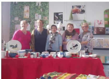
Expositions Ventes le 22 Novembre 2014 « Les vendeuses »