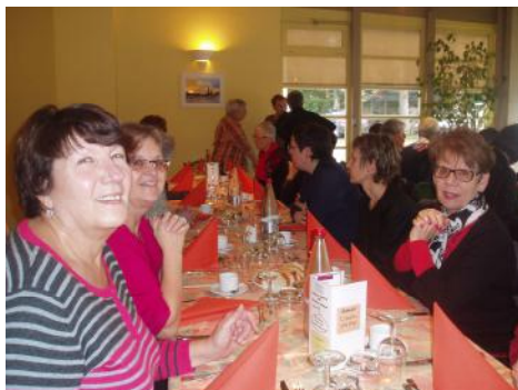
Repas des « Naiades » le 13 Décembre