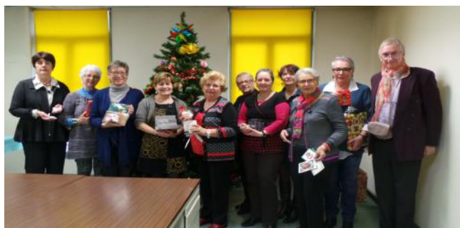
Loterie de Noël du 18 Décembre 2014

Tout le monde gagne au hasard du tirage les cadeaux ci-dessus.....et le sort a été très malicieux et bien